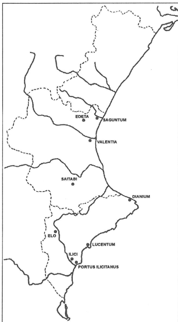
Situación de las ciudades romanas del País Valenciano mencionadas en el texto.

tenido que recurrir tanto a obras antiguas (Chabret 1888, Ibarra 1926) como a hallazgos recientes inéditos. La irregularidad del origen de la muestra sería una característica general del conjunto estudiado, habida cuenta los diferentes procesos por los que han llegado a nosotros. De esta manera, la mayor parte del material de Ilici , Saguntum y Lucentum procede de excavaciones antiguas y hallazgos esporádicos, poco fiables y con nula información estratigráfica, con lo que nos alejamos del que sería nuestro propósito principal, estudiar el material dentro de su contexto general, al modo como se ha podido hacer con la terra sigillata hispánica (TSH) de Valentia (Escrivà 1991).